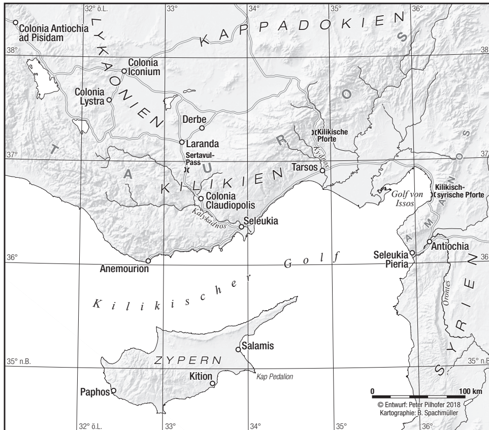
Abbildung 9: Keine Kenntnisse der Rückreise des Paulus in Apg 14

Anfang (von Antiochien über Seleukia bis nach Zypern: Salamis und Paphos) vorhanden ist, im mittleren Teil und am Schluß aber mehr und mehr verlorgen geht. Dieses Itinerar stammt sicher nicht von einem Reisebegleiter des Paulus.