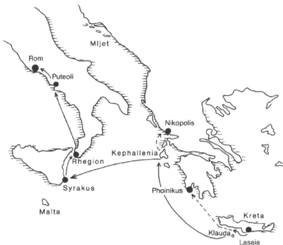
Abb. 3: Warneckes Weg nach Rom: West-Abschnitt 9

in seiner Greifswald-Erlanger Dissertation untersucht. 10 Dabei geht es vor allem um die unterhaltende Absicht des Lukas. Als guter Schriftsteller will Lukas seine Leserinnen und Leser eben auch durch eine spannende Geschichte unterhalten.